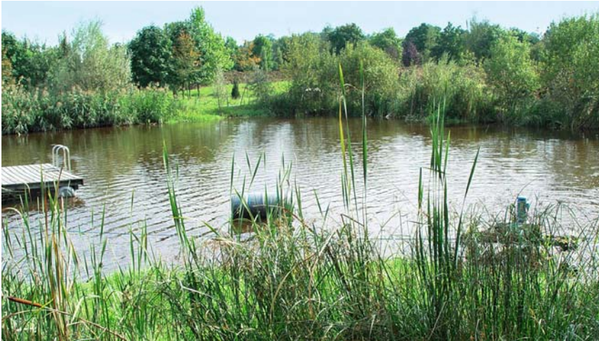
Der Fischteich dient als Endauffangbecken der Regenwasserverwertungsanlage.

Artenvielfalt liegt der Kunz Baumschulen AG am Herzen. Nun hat die Stiftung Natur & Wirtschaft das strukturreiche und naturnahe Areal der Baumschule als Naturpark ausgezeichnet.