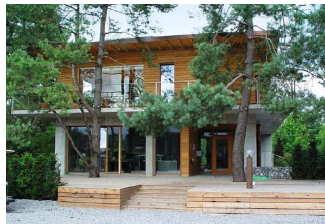
Das Bürogebäude fügt sich nahtlos in die Umgebung ein.